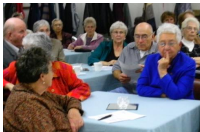
Rencontre organisée à Bonnyville