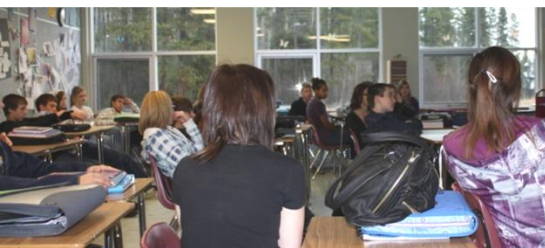
École Parkland Composite High School à Edson à gauche