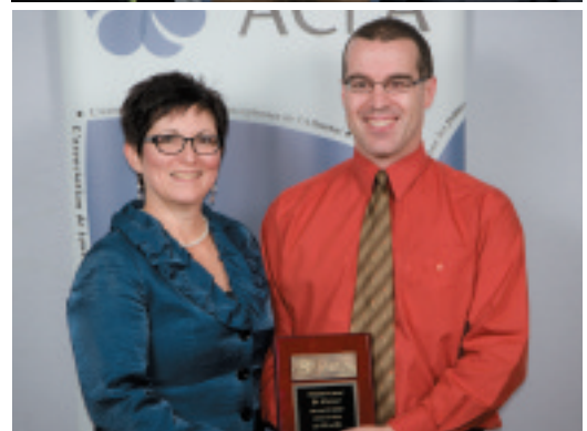
En juillet dernier, Le Franco a reçu le titre de Journal de l'année de l'Association de la presse francophone. L'ACFA a tenu à souligner cet honneur en remettant une plaque au journal.