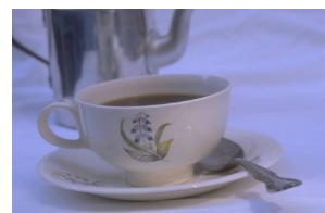
Caption describing picture or graphic.

exerci tation ullamcorper suscipit lobortis nisl ut aliquip ex ea commodo consequat. Duis te feugifacilisi per suscipit lobortis nisl ut aliquip ex ea commodo consequat. Lorem ipsum dolor sit amet, consectetur adipisc-