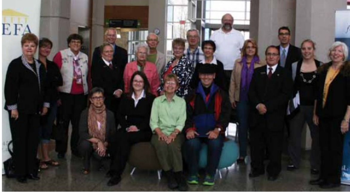
Les 20 participants et professionnels rassemblés au centre Genesis, le 1 er octobre dernier pour la première édition de la journée « S'informer pour mieux décider ».